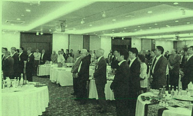
例年多くの参加者でにぎわう交流会

何卒、右記要領により開催致しますので、友人・知人・会社グループ等におかれましては、お誘い合わせ多数のご参加をお願いします。