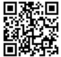
受講申込フォーム（Web）

新型コロナウイルス感染症拡大に伴う本講座（集成型研修）の対応について 今後の状況によっては、オンライン研修（Zoom使用）への切り替え、開催延期や中止とさせていただきます。予めご了承ください。 尚、各種変更が生じた際は、島原商工会議所ホームページにてご案内いたします。